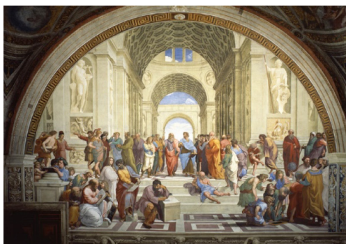
Figura 1: Raffaello Sanzio, Scuola di Atene (affresco, 1509-1511) - Stanza della segnatura, Musei Vaticani.

La prima immagine è la «Scuola di Atene», di Raffaello Sanzio 14 . L'opera esprime, in un certo senso, lo spirito del tema trattato – quello della crisi del sistema sanzionatorio – attraverso la duplice prospettiva giuridica e storica.