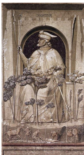
Figura 2: Giotto di Bondone, Allegoria dell'ingiustizia (afresco, 1306) - Cappella degli Scrovegni, Padova.

Questa distanza o meglio questa sproporzione tra la figura del giudice e l'altezza degli alberi rimanda al superamento di una concezione di giustizia che invece appartiene profondamente alla nostra tradizione. L'amministrazione della giustizia nasce antropologicamente all'insegna del «sacro» 17 , quale spazio dignitoso e della pensosità individuato dall'albero. Quest'ultimo diventa locus di giustizia: si pensi alla tradizione agiografica che narra di San Luigi, il quale amministrava la giustizia sotto una quercia del bosco di Vincennes 18 .